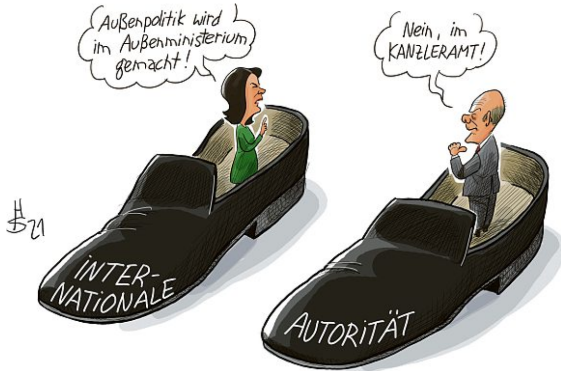
In Merkels Schuhen

Das politische Interesse am Schicksal eines Mannes, der Kriegsverbrechen aufgedeckt hat, hat sich unter der Regierung Merkel-Scholz in Grenzen gehalten. Während der Fall des russischen Oppositionspolitikers Alexej Nawalny Chéfsache wurde und schwere Spannungen mit Moskau auslöste, wird der Fall Assange totgeschwiegen. Die neue Regierung hätte hier die Möglichkeit, es besser zu machen: Bundesaußenministerin Annalena Baerbock will ja die Menschenrechte forcieren und eine wertorientierte Außenpolitik betreiben. Die FDP hatte zumindest vor der Wahl angegeben, sie wolle sich vorbehaltlos für Menschen- und Bürgerrechte einsetzen. Der Fall Assange wird über die Glaubwürdigkeit dieser Bekenntnisse entscheiden.