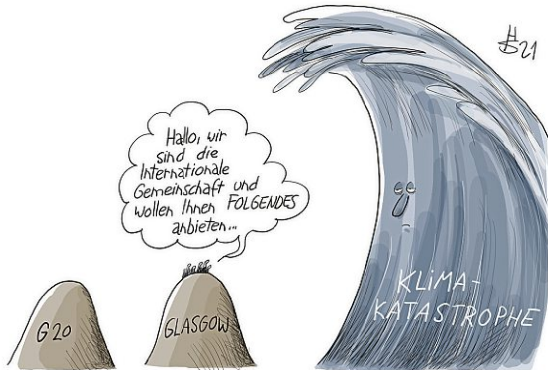
Verhandeln auf Augenhöhe

Es ist gut, dass jemand bei diesem Thema vorangeht. Gleichzeitig wissen alle, wie sehr sich die designierte Regierende Bürgermeisterin in der Rolle der Anpackerin gefällt, die zwar optimistisch ist, aber auch betont nüchtern. Und das birgt Gefahren innerhalb des Bündnisses. Wenn also Franziska Giffey sagt, „wir brauchen nicht immer wieder neue Blühträume“, dann werden sich in erster Linie die Grünen angesprochen fühlen. Was wird dann aus Bullerbü?