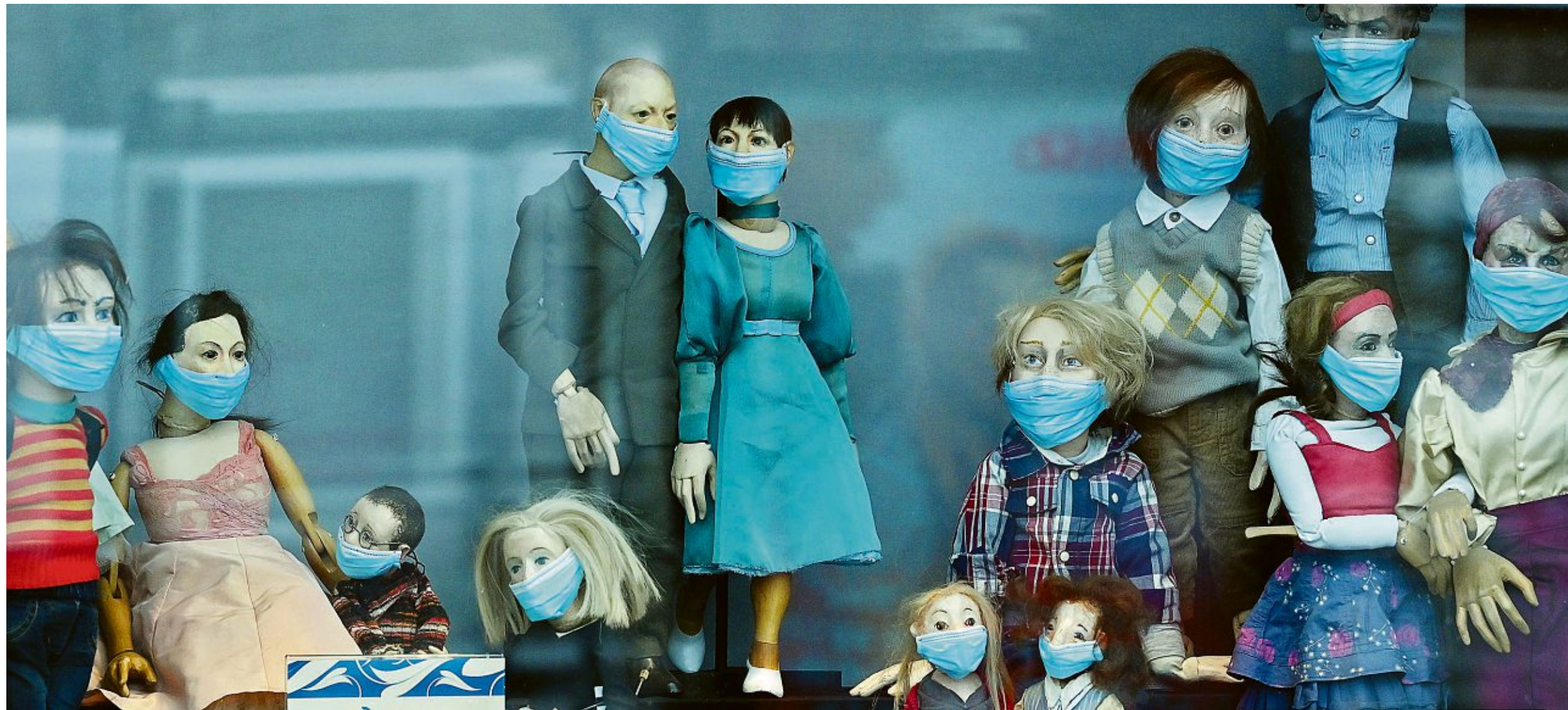
Die Pandemie prägt den Alltag weiterhin. In diesem Erfurter Puppentheater tragen sogar die Figuren schon Masken.