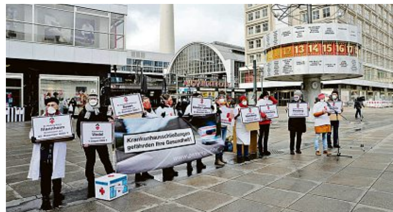
Das Bündnis Klinikrettung demonstriert auf dem Alexanderplatz.

Derzeit, sagt Busse, gibt es in Deutschland 1450 Krankenhäuser mit einer Akutversorgung, die insgesamt auf 420.000 Betten kommen. Im Durchschnitt deckt jedes Haus ein Gebiet von 57.000 Einwohnern ab. Gravierende Unterschiede gibt es zwischen Provinz und Metropole. Berlin allein verfügt über 51 Kliniken. Busse sagt, dass viele Krankenhäuser nicht für die Be-