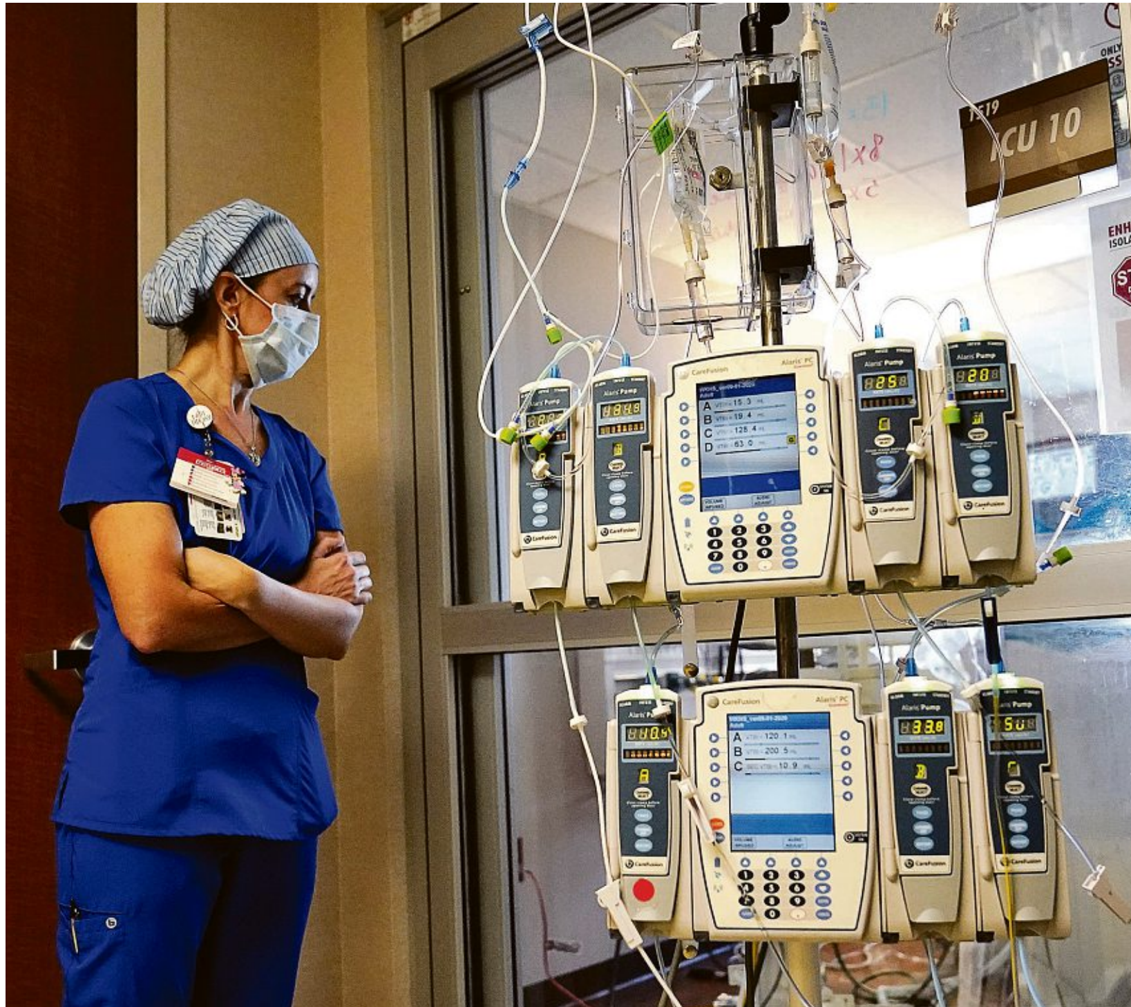
Kinderkliniken in vielen US-Bundesstaaten verzeichnen seit einigen Wochen einen rapiden Anstieg der Patienten mit schweren Corona-Verläufen.

Absolute Fallzahlen des Robert-Koch-Instituts (RKI) zeigen, dass in der 33. Kalenderwoche 2021 bei insgesamt 54 Kindern zwischen null und vier Jahren, bei 42 Kindern zwischen fünf und 14 Jahren und bei 296 Jugendlichen und Erwachsenen zwischen 15 und 34 Jahren eine Hospitalisierung vorlag. „In die Daten werden die jungen Menschen aufgenommen, weil bei ihnen ein positiver Sars-CoV-2-Befund festgestellt wurde. Aber ein Test, der positiv ausfällt, bedeutet