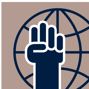
Themenwoche Digitale Gewalt: Wie geht es Betroffenen? Was kann man tun?

Es gibt Grundgefühle, die uns angeboren sind. Angst ist ein sehr dominantes Gefühl und auch für Aggressivität und Wut haben wir Anlagen. Letztere Gefühle helfen uns durchzusetzen, uns gegen Ungerechtigkeiten zu wehren oder Ziele, die wir uns gesetzt haben, zu