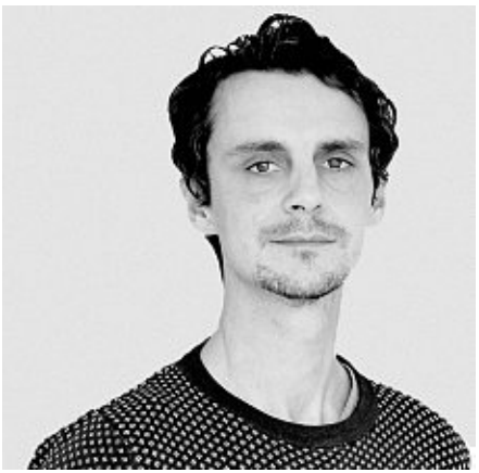
Paul Linke BERLINER VERLAG

Daran musste ich neulich denken, als ich an den verwitterten Holztribünen der Avus vorbeifuhr, raus aus Berlin, rein nach Brandenburg, ein paar Kilometer, immerhin. Nach Monaten der freiwilligen Stadtgefangenschaft fühlte sich Stahnsdorf so befreiend an wie, sagen wir mal, Saint-Tropez. Eigentlich weiß ich gar nicht, wie Saint-Tropez sich anfühlt, aber weil die Sonne mich mit einem eingebildet warmen südfranzösischen Akzent ansprach und ich einen Impftermin bekommen hatte, hatte ich plötzlich eine Vorstufe zum Glückseligkeit erklommen.