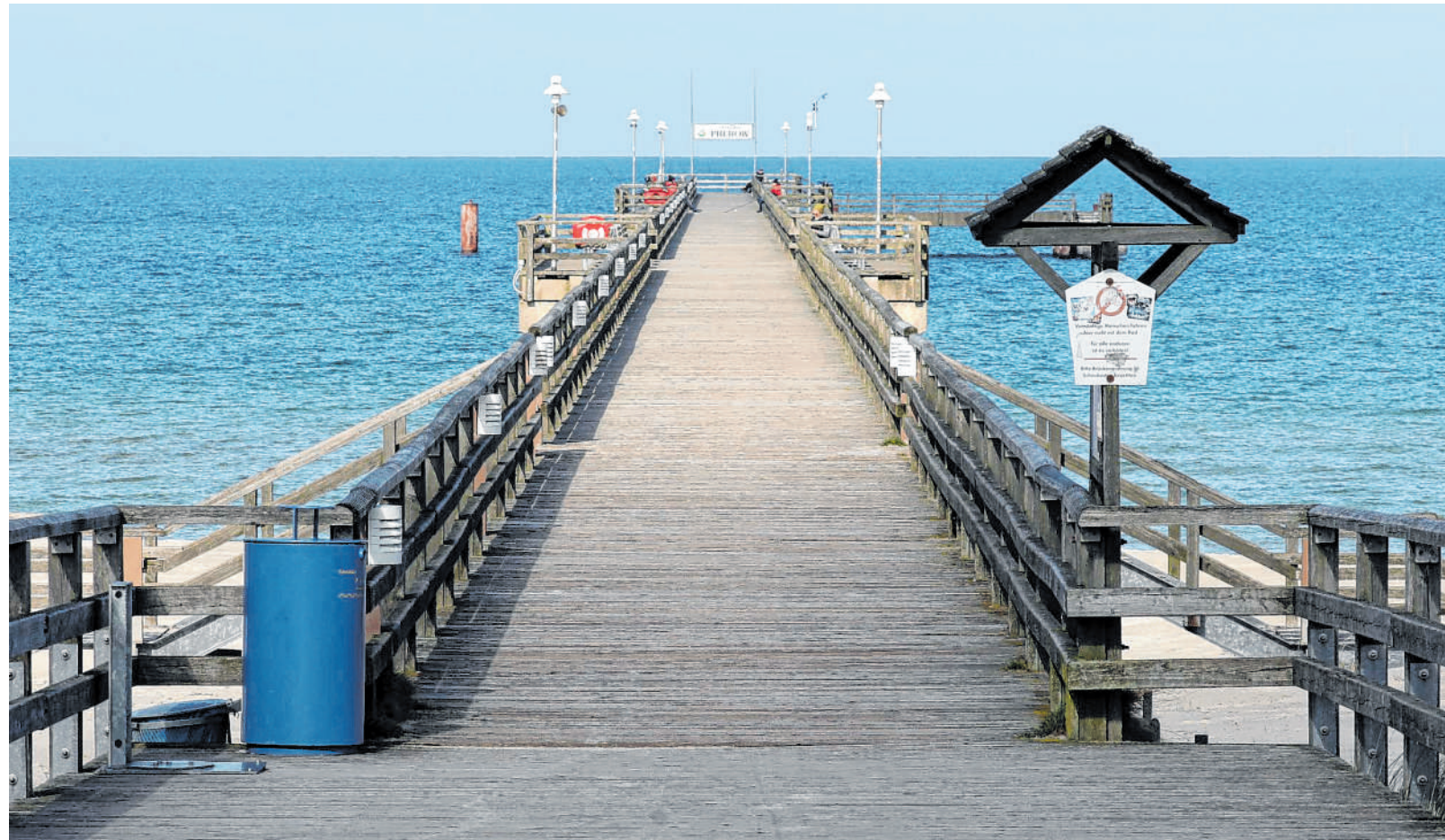
Die Seebrücke im Ostseebad Prerow: Mecklenburg-Vorpommern wird seine Grenze ab dem 25. Mai auch für Gäste aus anderen Bundesländern öffnen.

„Dithmarscher Landeszeitung“ Der Begriff Befreiung wird schon lange und bis heute anders als 1985 von Richard von Weizsäcker gemeint ausgelegt, nämlich als Befreiung davon, für den (...) Krieg Verantwortung zu übernehmen. Denn viel zu oft wird die Übernahme von Verantwortung damit verwechselt, ein persönliches Schuldbekenntnis abgeben zu müssen. Darum aber geht es nicht. Es geht um die Pflicht zur Erinnerung. dpa