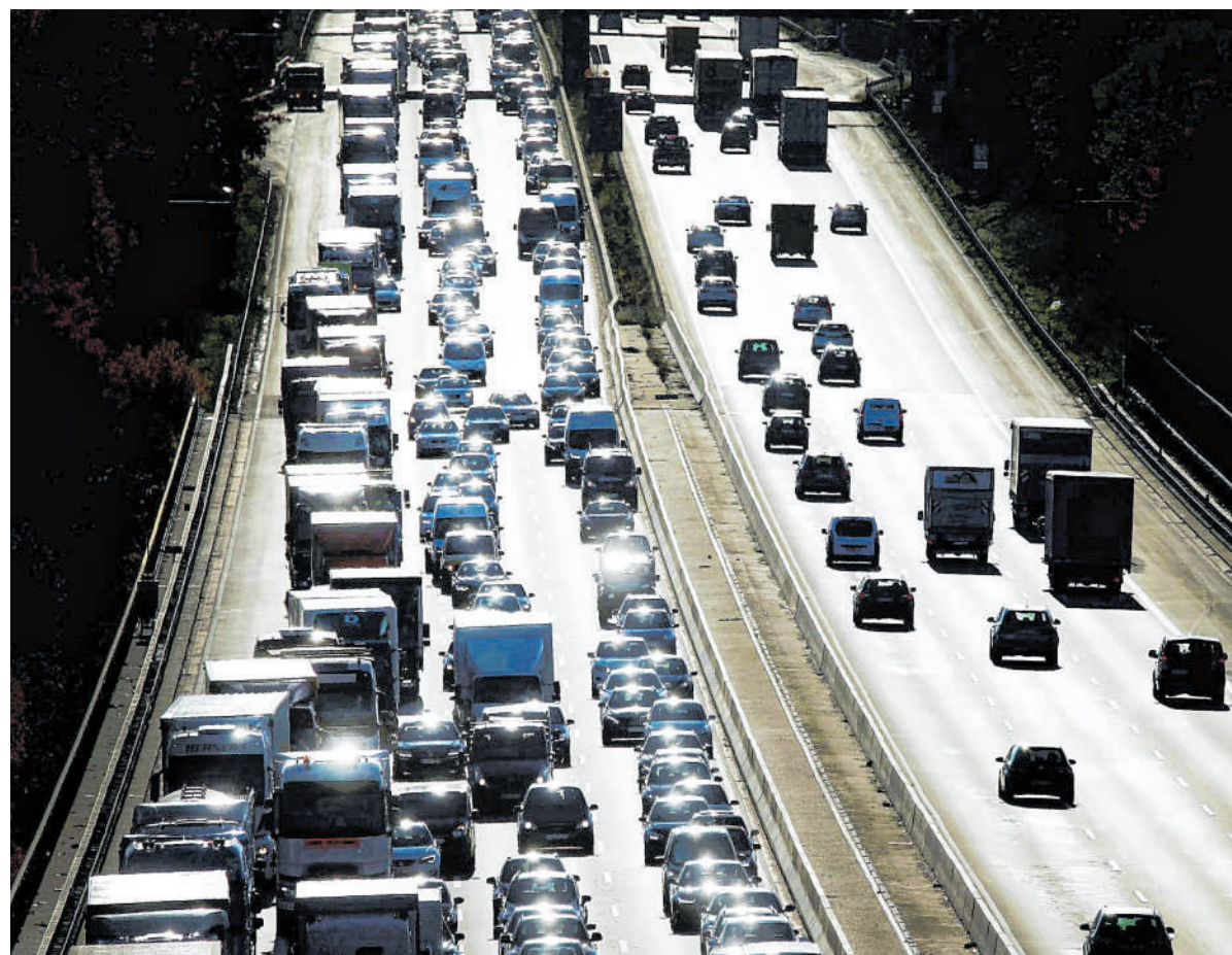
Auf der Autobahn 3 bei Düsseldorf stehen Autos in einer Fahrtrichtung in einem langen Stau.

Eine wichtige Rolle spielt auch die Verpflegung: Der Verkehrsclub ADAC rät zum Beispiel, niemals mit leerem oder vollen Magen loszufahren. Da ist eine Übelkeitswelle schon vorprogrammiert. Getränke mit Kohlensäure schlagen während der Fahrt schnell auf den Magen – unterwegs solltest du also eher