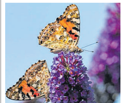
Falter saugen Nektar von Blüten eines Sommerfiedlers.

Wie lege ich einen Garten an? Wie heißt der größte Fisch der Welt? Das erfahren Kinder bei den Naturdetektiven auf der Kinderseite des Bundesamts für Naturschutz. Die Seite www.naturdetektive.bfn.de gehört zu den Tipps, die Jugendschutz.net für das Thema „Umwelt-Spezial“ zusammengestellt hat. Rund ums Energiesparen, gesunde Ernährung und Müllvermeidung geht es auf www.oekoleo.de (Hessisches Umweltministerium). Wie schon die Kleinen zu Umweltschützern werden, erklärt die Kinderseite der Naturschutzjugend (NAJU). Mit Experimenten können dort Lebensräume wie Gebirge und Wälder entdeckt werden. tmm