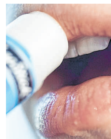
Lippen sollten im Sommer gut gepflegt werden.

Wenn du dich mit deiner Zunge vortastest, spürst du, dass der innere Bereich der Lippen feucht ist. Er ist bedeckt mit der Mundschleimhaut, die dafür sorgt, dass die Haut nicht austrocknet. Im Außenbereich sind die Lippen dagegen mit einer sehr dünnen, aus drei bis fünf Zellschichten bestehenden Haut verkleidet. Zum Vergleich: Die übrige Gesichtshaut besitzt bis zu 16 Zellschichten und an den Fußsohlen ist die Haut 50 Mal dicker. Weil sie also dünn ist, scheint das Blut der darunter liegenden Gefäße stärker hindurch als bei der restlichen