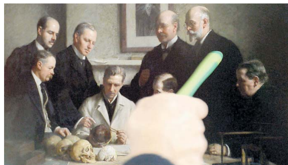
Der Fälscher Woodward (rechts stehend) beobachtet, wie der Schädel des Pitdown-Menschen begutachtet wird. Szene aus der Arte-Dokumentation vom 21. 5. 2016

Eoanthropus dawsoni – so hießen die angeblichen Überreste eines Frühmenschen, die im Dezember 1912 von Arthur Smith Woodward in einer Kiesgrube bei dem Dorf Pitdown in Südostengland ausgegraben wurden, aber 1953 als Fälschung entlarvt wurden. Der Pitdown-Mensch, wie der unechte Urahne genannt wird, gilt als der dreiste Wissenschaftsbetrug aller Zeiten. Jüngste genetische Analysen der Fossilien haben nun ergeben, dass Woodward wohl allein gehandelt hat und die Knochen von zwei Menschen und einem Orang-Utan kombinierte. Was den Anthropologen zu seiner Tat bewogen hat, bleibt sein Geheimnis. (mli)